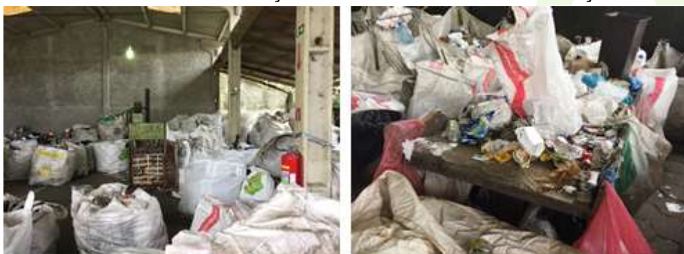
FIGURA 2 - ASSOCIAÇÃO DE CATADORES NOVA ESPERANÇA

Com previsão para o primeiro semestre de 2019, o projeto junto à Associação de Catadores Nova Esperança será ceder em regime comodato equipamentos que permitam ganhos de produtividade com melhor qualidade e segurança na operação. O investimento previsto será de R$ 110.000,00 em equipamentos como triturador de vidros, compactador horizontal e esteira para triagem.