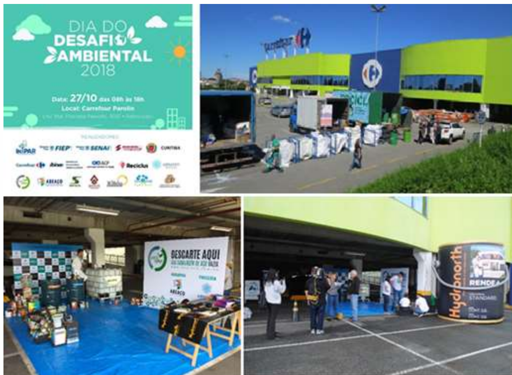
FIGURA 1 - DIA DO DESAFIO AMBIENTAL - CURITIBA/2018.

Em 2018, o evento foi realizado no pátio do Carrefour Parolin e recolheu mais de 5 toneladas de resíduos; das quais os recicláveis foram destinados à Associação de Catadores de Corbélia (Curitiba/PR). Ao todo, o InPAR investiu R$ 1.880,00 no evento.