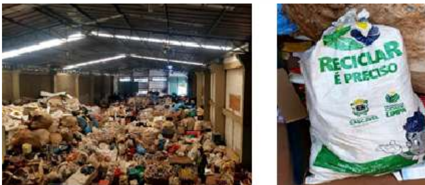
FIGURA 3 - COOPERATIVA COTACAR