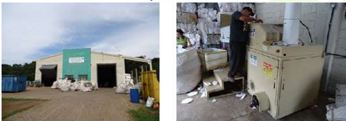
FIGURA 4 - ASSOCIAÇÃO DE CATADORES DE CORBÉLIA

O investimento na associação será analisado no ano de 2019. Caso seja efetivado o projeto, o InPAR cederá e em regime comodato equipamentos que permitam ganhos de produtividade com melhor qualidade e segurança na operação. O investimento previsto será de R$ 85.000,00 em equipamentos como triturador de vidros e compactador horizontal.